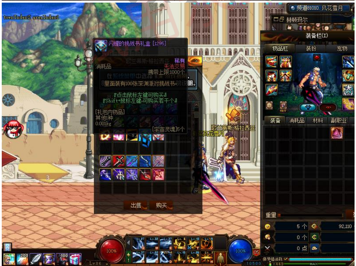
若深渊票不足，则可通过刷远古图、魂远古图、南部溪谷获得，建议每日